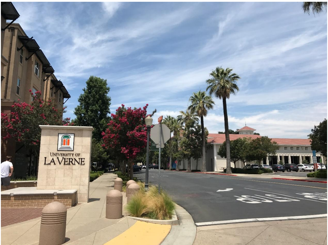
图为拉文大学校园内

初到美国，一切与过往接触的所有不同的事情都冲击着我们的所思所想。走入校园，优美的环境、和蔼的老师、完善的校园设施让我们对这里接下来的三周游学生活充满了期待。