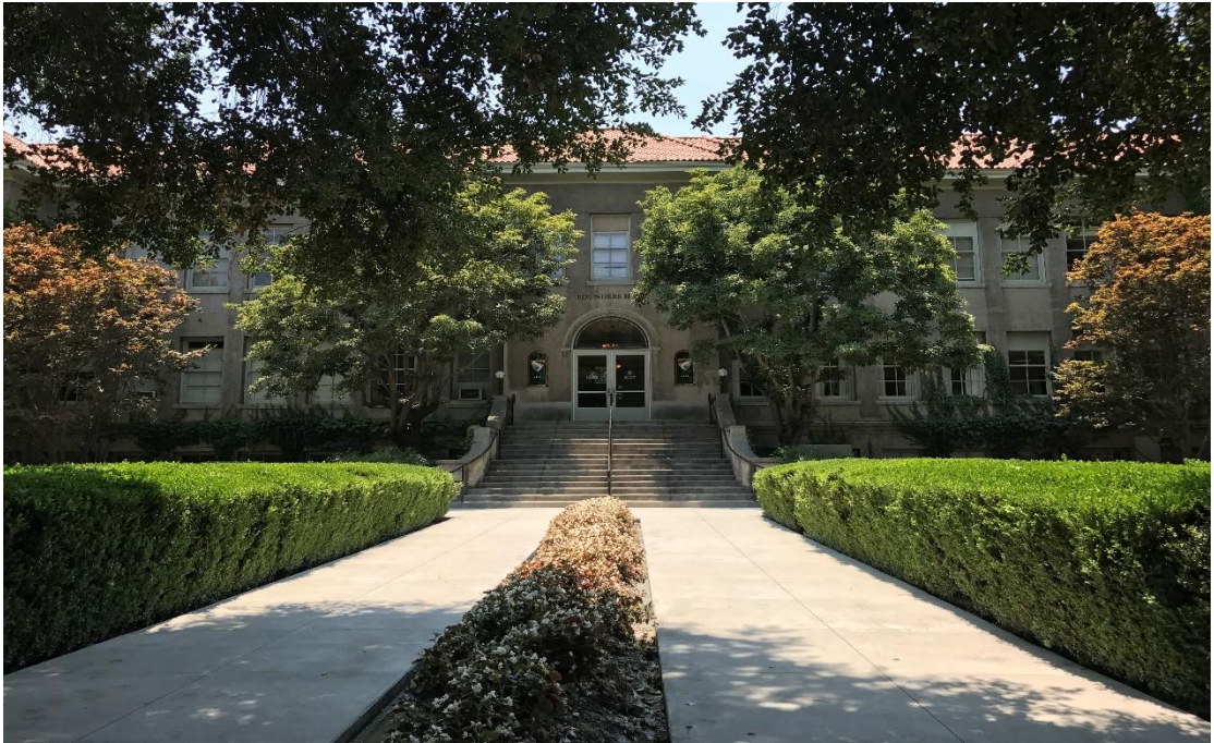
图为拉文大学教学楼

我们上课的一个班级很小，一般 15 个人左右。由于课堂人数较少，课堂氛围就比较轻松，多以讨论式教学为主，老师对学生的要求就是尽量参与到课堂活动中去，只要有什么问题举手就行。课堂上你也不会觉得有太多的拘束，有时老师干脆直接坐到讲台上来讲课，学生也可以在课堂上表达自己的观点与看法，让思维得到极大开阔。