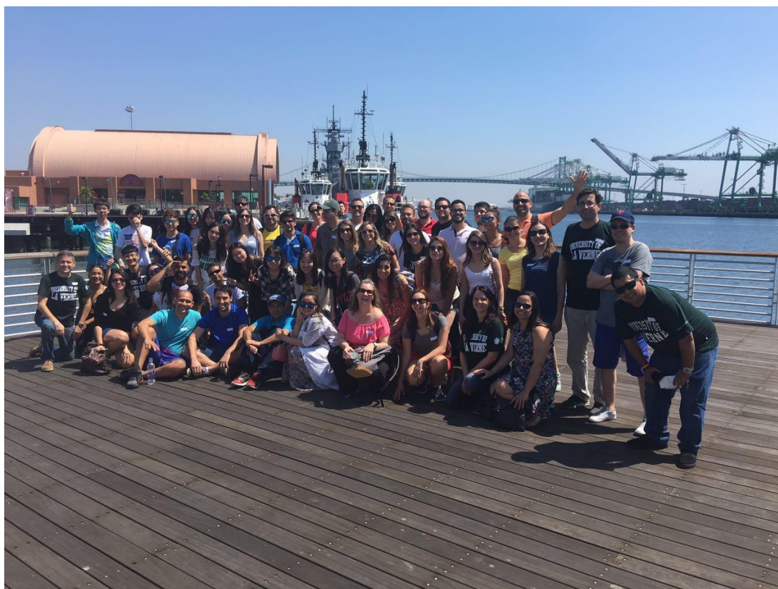
图为参观洛杉矶港口

在拉文待的三个星期每天都过得非常的充实有意义，时间不知不觉就溜走了，在我们渐渐熟悉并且喜欢上这里的时候，一切就要说再见了。这次美国之行，我感触最深的就是要认真对待你所做的事，无论大小，都要努力做到最好。除此之外，我发现能表达出自己的观点是一件很不错的感觉，很有成就感，很有趣，很开心，在分享、相互交流碰撞中，让我们不仅开拓了国际化视野，打开眼界，敞开心灵，也让我们开动脑筋，不断迸发出思想的火花。最后感谢同行的老师和同学们一路的帮助，使得这次游学之行圆满结束！